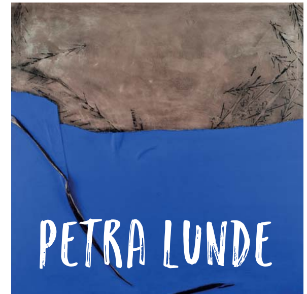
„Der Berg ru(f)tscht“, 2015

Sechste Ausstellung in der Reihe KUNST UND KULTUR unter der KAPELLE